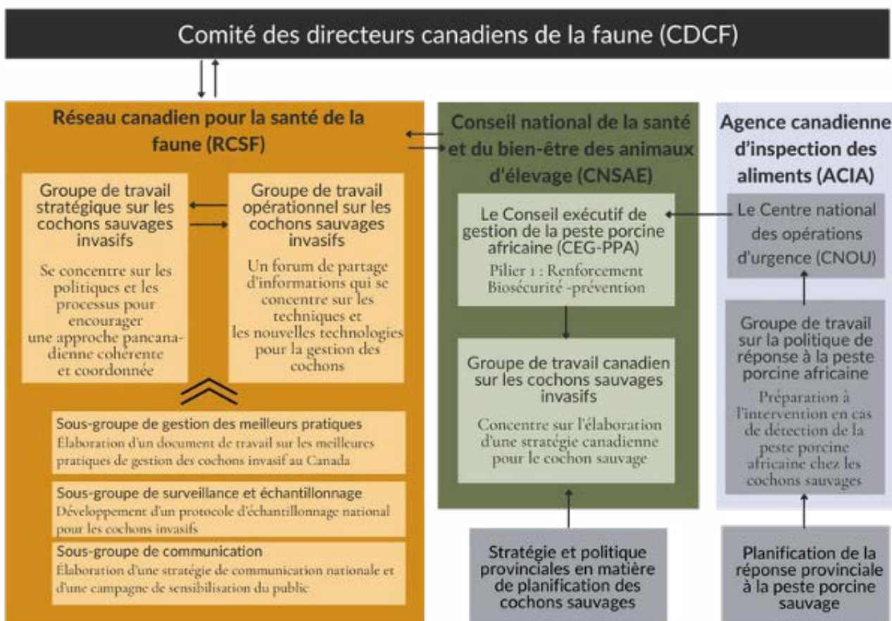
Groupes de travail sur les cochons sauvages invasifs - Organigramme